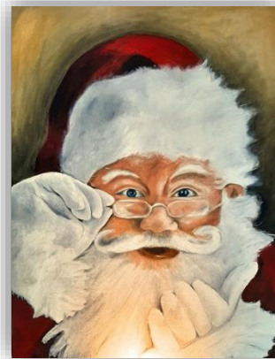
Motiv Adventskalender 2023

Im Laufe des Jahres gibt es verschiedene Aktivitäten, die wir durchführen, um Spenden und Einnahmen für die Projekte zu erhalten. Wir haben einen Verkaufsstand auf dem Weinfest in Bad Bramstedt und auf dem Weihnachtsmarkt in Kaltenkirchen, unseren Lionsball und „Tanz in den Mai“ in Kisdorf und unseren jährlichen Adventskalender mit Verkaufsständen. Bei allen Aktivitäten werden wir von örtlichen Firmen und dem Einzelhandel tatkräftig mit Sach- und Barspenden